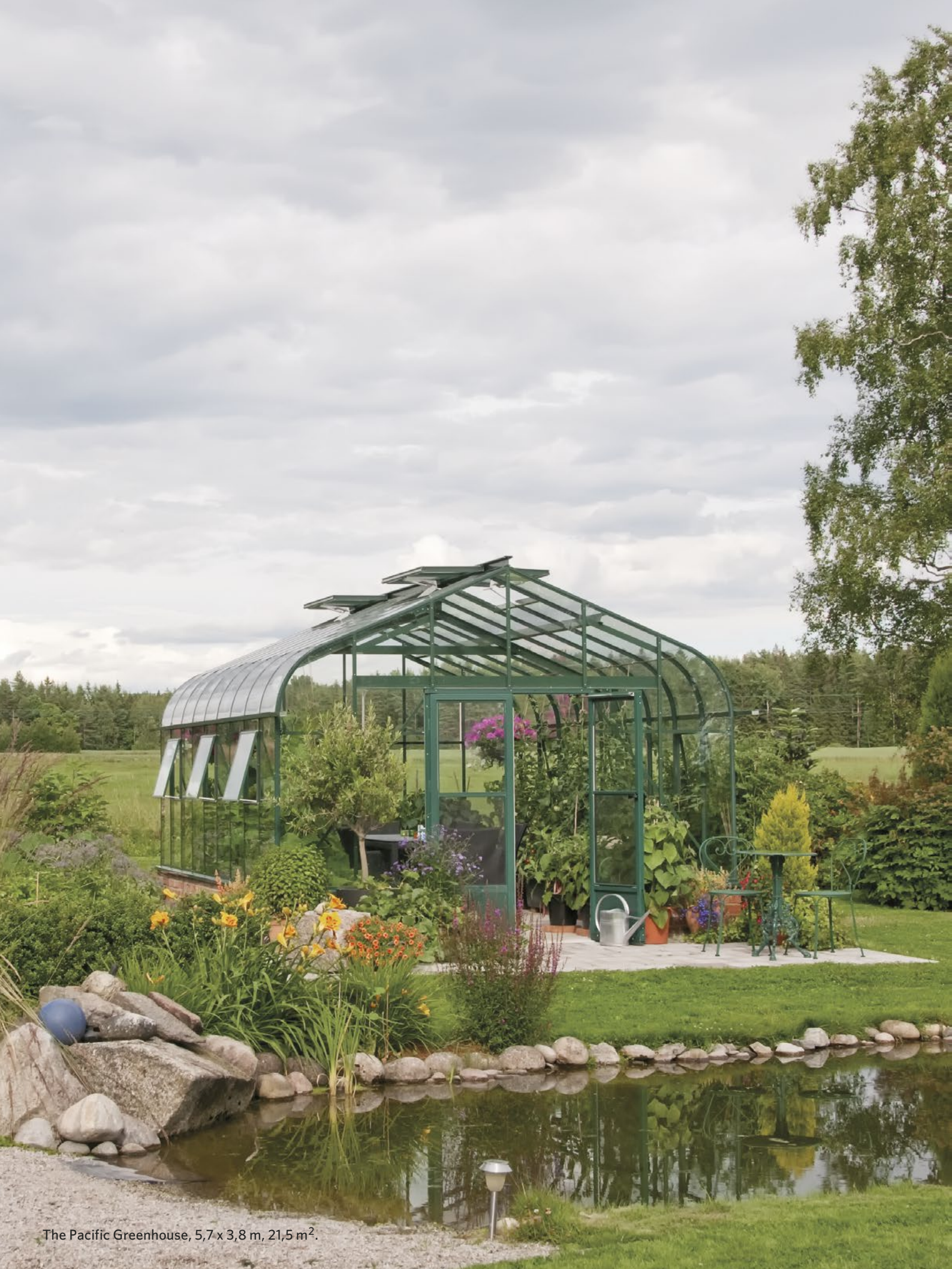
The Pacific Greenhouse, 5,7 x 3,8 m, 21,5 m 2 .