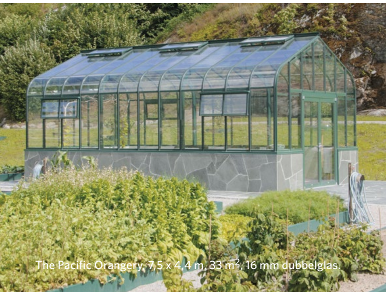
The Pacific Orangery, 7,5 x 4,4 m, 33 m 2 , 16 mm dubbelglas.