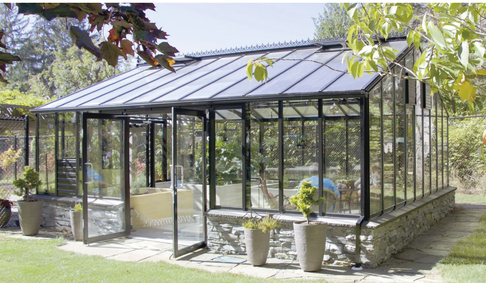
The Traditional Orangerie, 7 x 5,7 m, 40 m 2 , 16 mm dubbelglas, 51 mm ytterprofil.