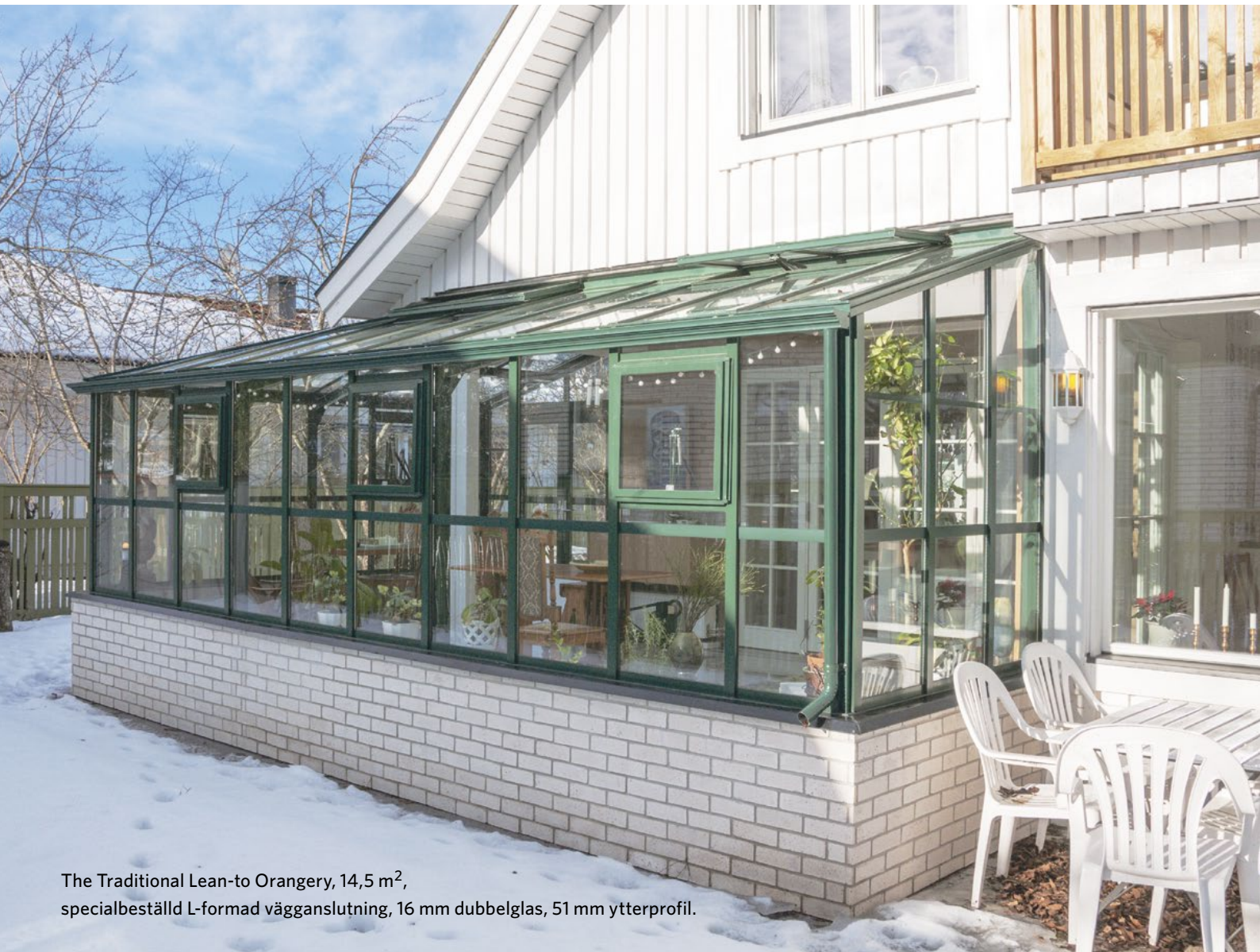
The Traditional Lean-to Orangerie, 14,5 m 2 , specialbeställd L-formad vägganslutning, 16 mm dubbelglas, 51 mm ytterprofil.

Vägganslutet – praktiskt och lättåtkomligt