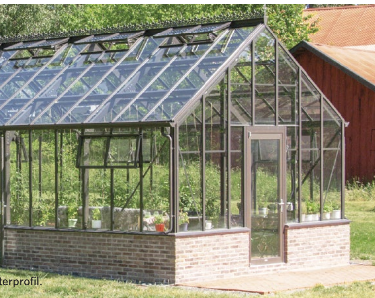
The Cottage Gable Attached Orangeri, 5,1 x 4,5m, 23 m 2 , specialbeställd takvinkel 28 grader, 51 mm ytterprofil.