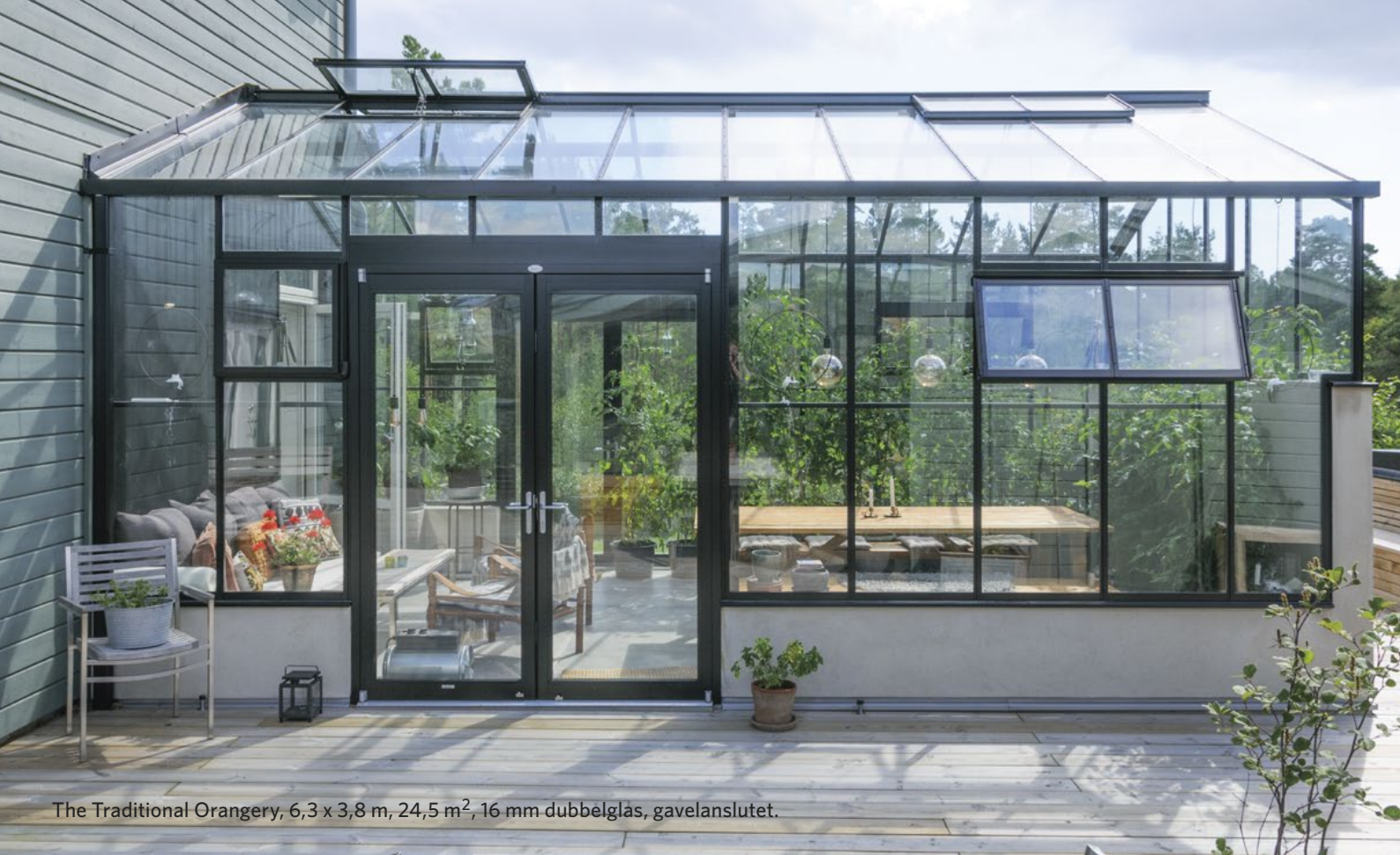
The Traditional Orangerie, 6,3 x 3,8 m, 24,5 m 2 , 16 mm dubbelglas, gavelanslutet.