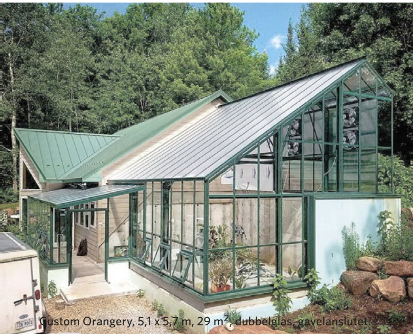
Custom Orangeri, 5,1 x 5,7 m, 29 m 2 , dubbelglas, gavelanslutet.