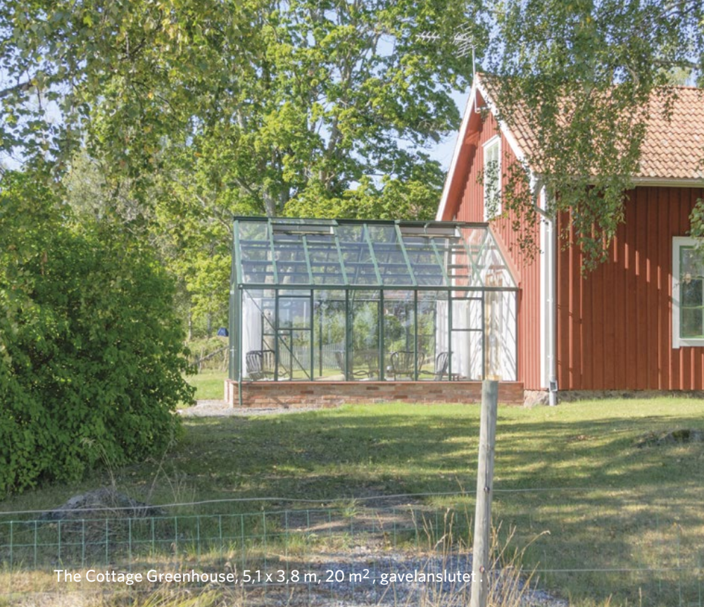
The Cottage Greenhouse, 5,1 x 3,8 m, 20 m 2 , gavelanslutet