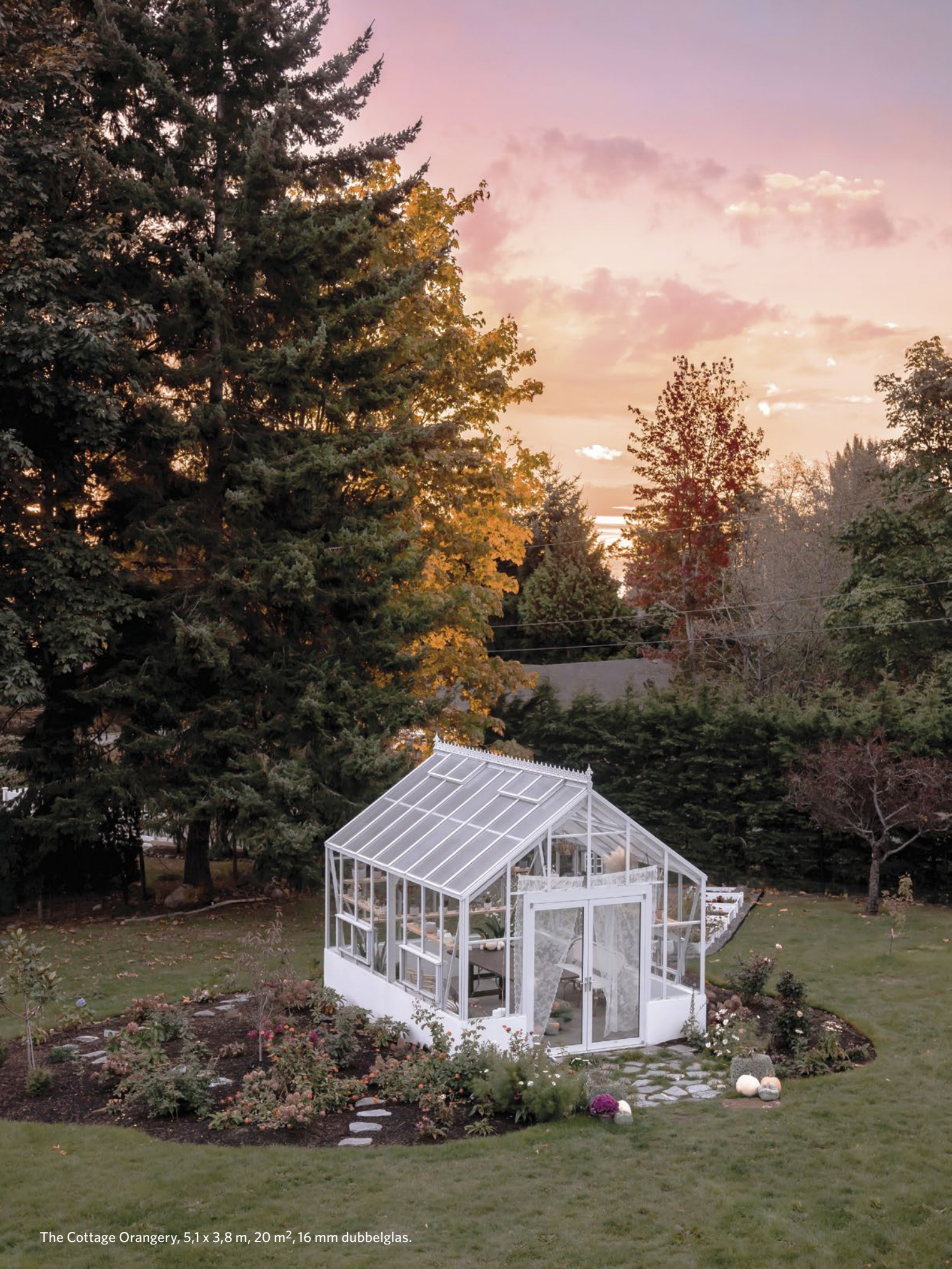
The Cottage Orangery, 5,1 x 3,8 m, 20 m 2 , 16 mm dubbelglas.