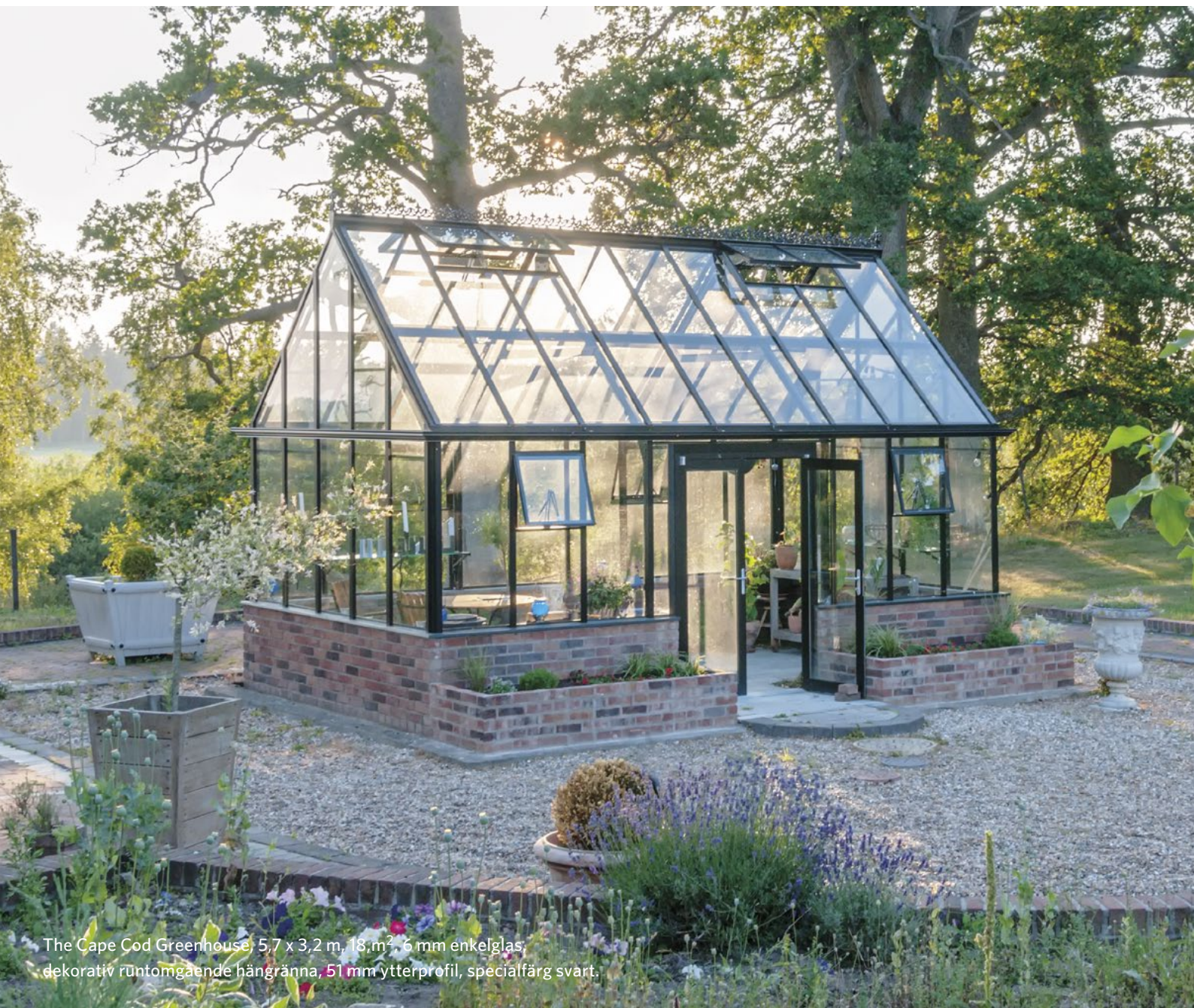
The Cape Cod Greenhouse, 5,7 x 3,2 m, 18,m 2 , 6 mm enkelglas, dekorativ rümtomgående hänggränna, 51 mm ytterprofil, specialfärg svart.