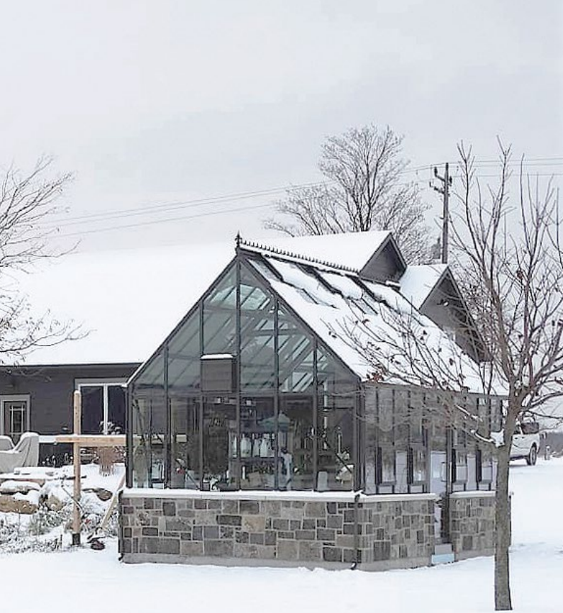
The Cape Cod Orangeri, 6,3 x 3,8 m, 24,5 m 2 , 16 mm dubbelglas, 51 mm ytterprofil.