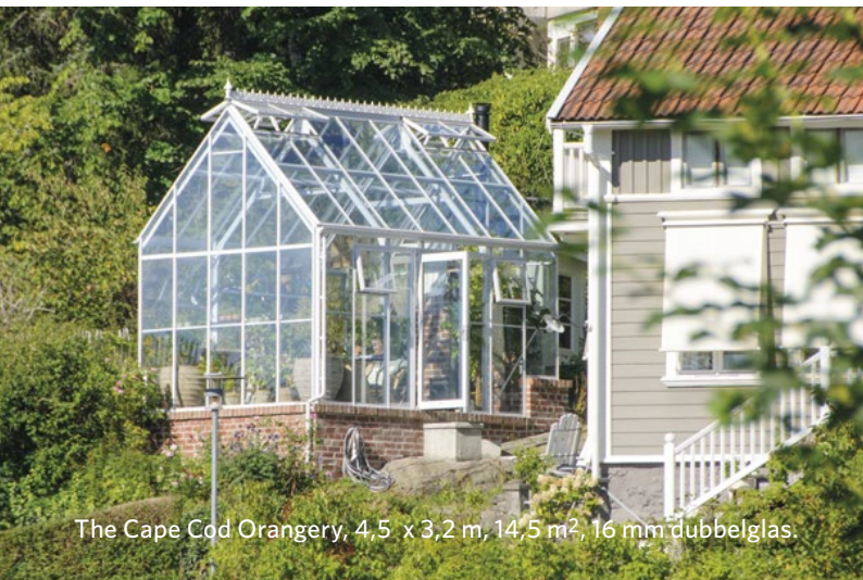
The Cape Cod Orangeri, 4,5 x 3,2 m, 14,5 m 2 , 16 mm dubbelglas.