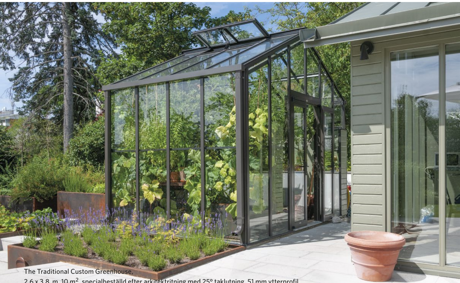
The Traditional Custom Greenhouse, 2,6 x 3,8 m, 10 m 2 , specialbeställd efter arkitektritning med 25° taklutning, 51 mm ytterprofil..