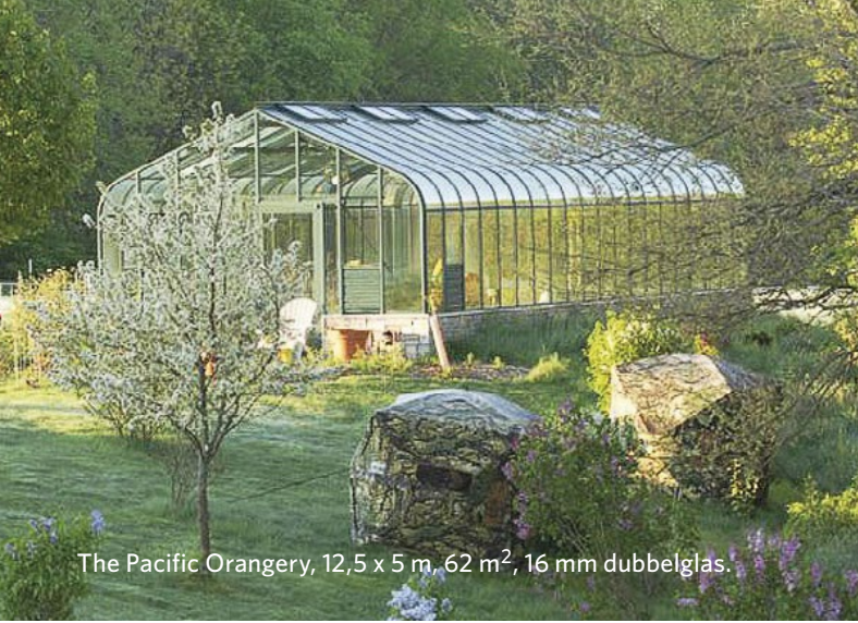
The Pacific Orangery, 12,5 x 5 m, 62 m 2 , 16 mm dubbelglas.