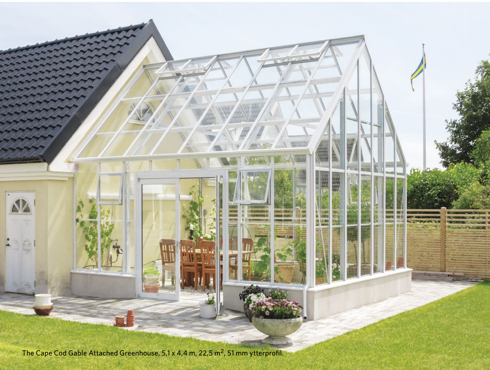
The Cape Cod Gable Attached Greenhouse, 5,1 x 4,4 m, 22,5 m 2 , 51 mm ytterprofil.

Utöka bostadsytan med ett extraordinärt utrymme. Njut av natur och trädgård sommar som vinter i ett magiskt rum av glas. Våra vägganslutna växthus och orangerier uppfyller högsta kvalitetskrav och kan anpassas och modifieras för alla typer av befintlig byggnader.