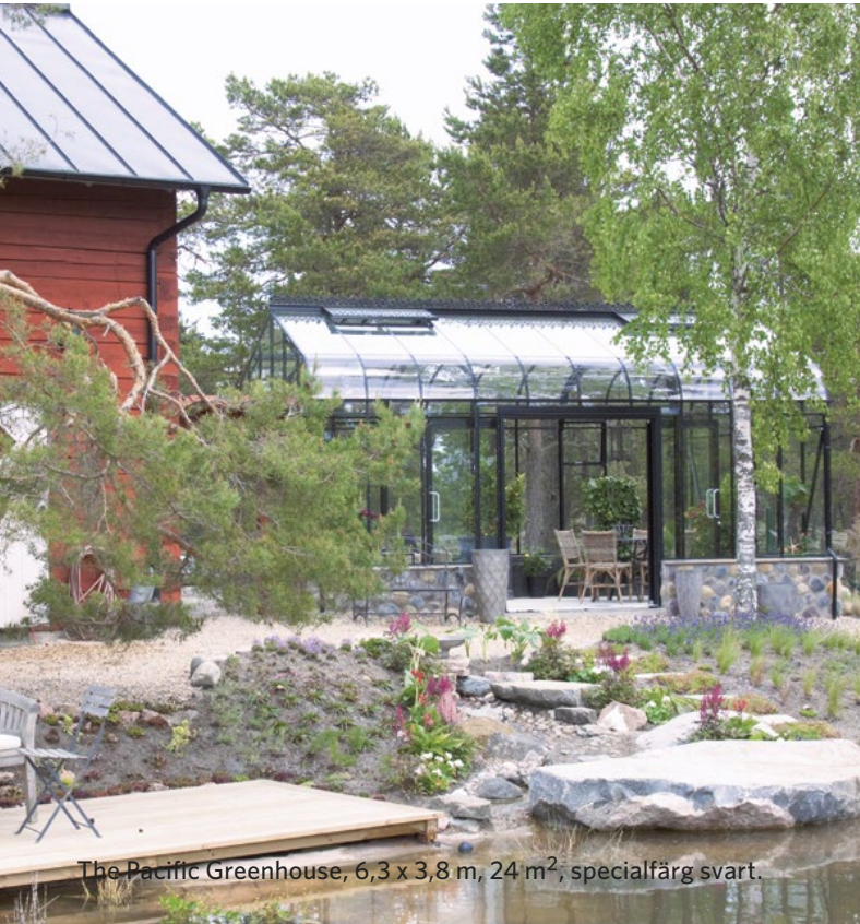
The Pacific Greenhouse, 6,3 x 3,8 m, 24 m 2 , specialfärg svart.