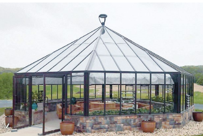
Octagonal Custom Orangeri, specialbeställt åttakantigt orangeri, 72 m 2 , 16 mm dubbelglas, 51 mm ytterprofil.

Ta kontakt för information om priser, storlekar, glas- och profilalternativ.