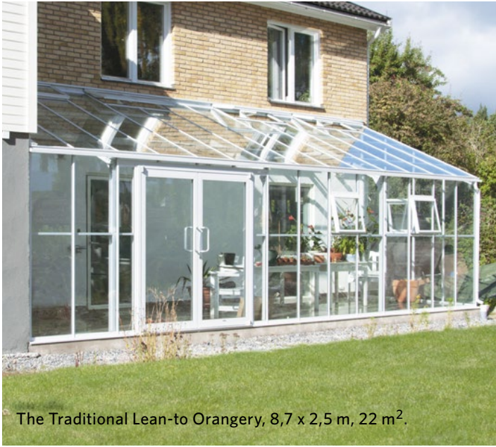
The Traditional Lean-to Orangery, 8,7 x 2,5 m, 22 m 2 .