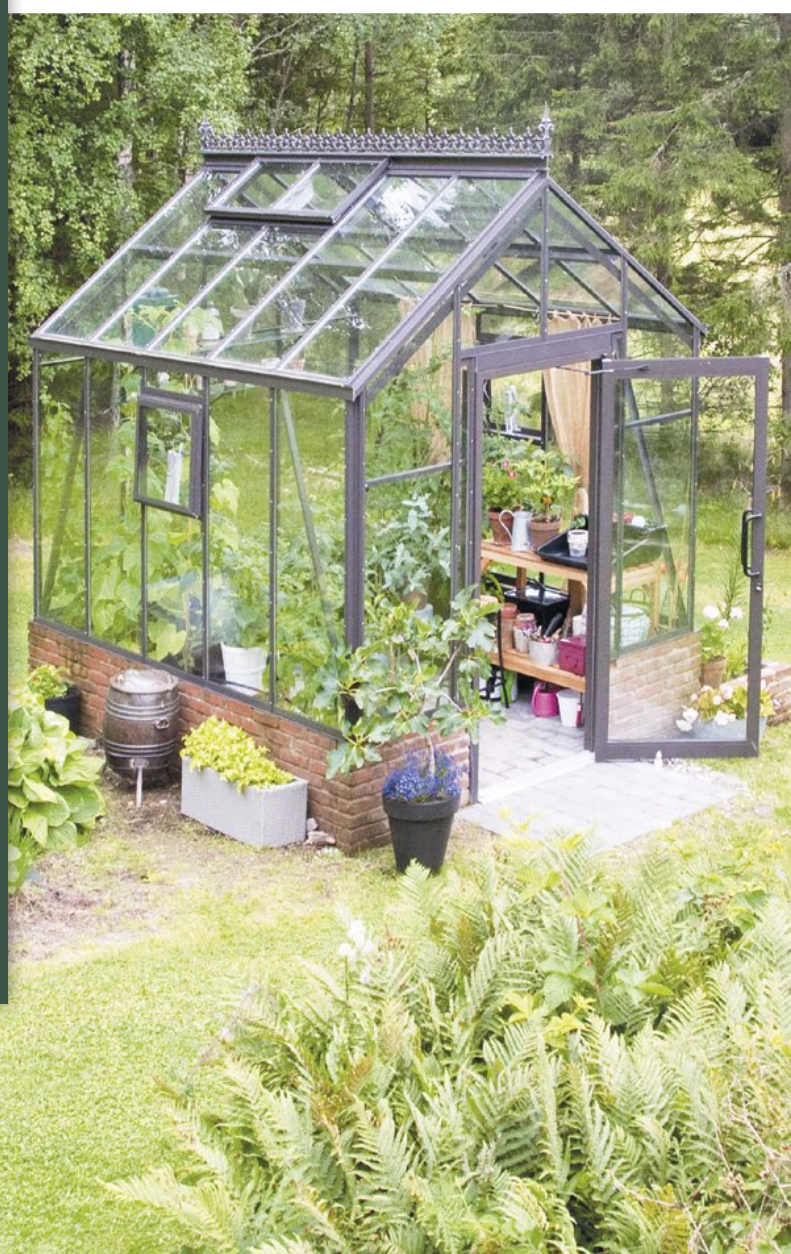
The Cottage Orangeri, 3,2 x 2,6 m, 8 m 2 .

GARANTI: BC Greenhouse Builders ger 25 års garanti på växthusets eller orangeriets aluminiumstomme.