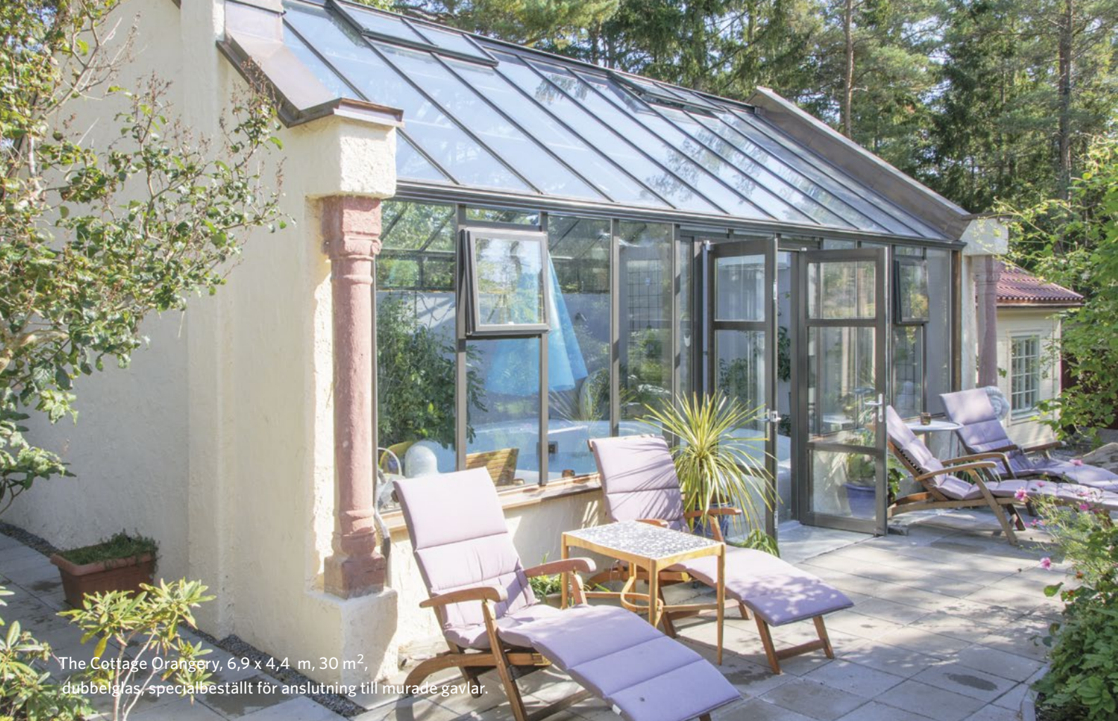
The Cottage Orangery, 6,9 x 4,4 m, 30 m 2 , dubbelglas, specialbeställt för anslutning till murade gavlar.