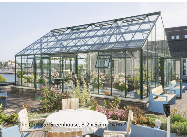
The Cottage Greenhouse, 8,2 x 5,7 m, 47 m 2 .