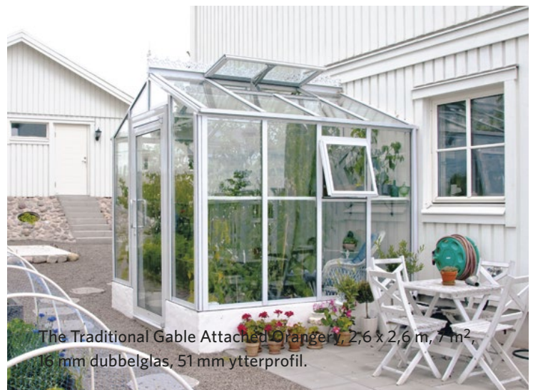
The Traditional Gable Attached Orangery, 2,6 x 2,6 m, 7 m 2 , 16 mm dubbelglas, 51 mm ytterprofil.