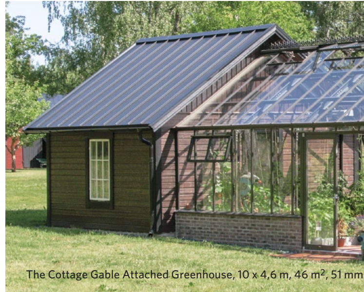
The Cottage Gable Attached Greenhouse, 10 x 4,6 m, 46 m 2 , 51 mm ytterprofil.