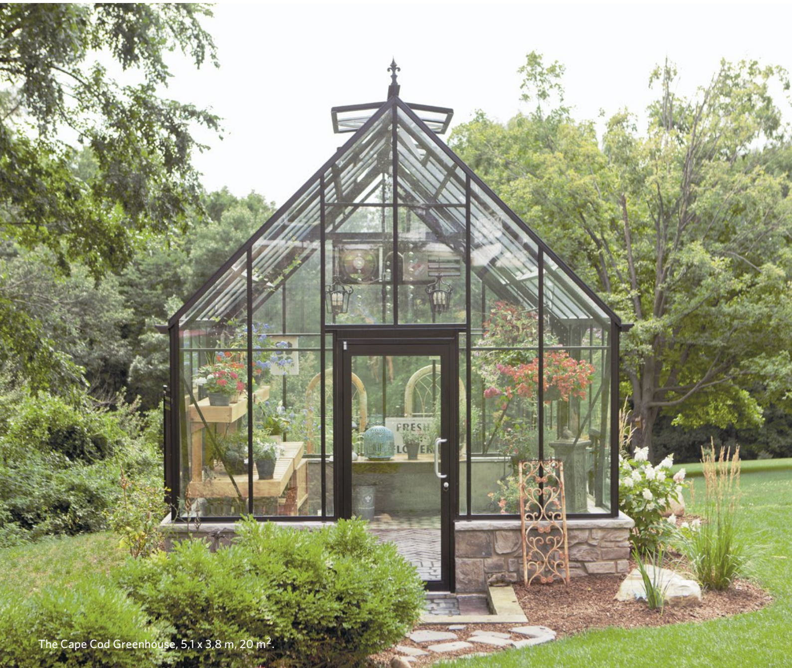
The Cape Cod Greenhouse, 5,1 x 3,8 m, 20 m 2 .

Vår dragningskraft till växthus är obestridlig. Praktiskt taget alla trivs med närhet till naturen. Ett växthus eller orangeri erbjuder massor med möjligheter att förlänga vår, sommar och höst i trädgården. Och vackrare vindskydd finns inte.