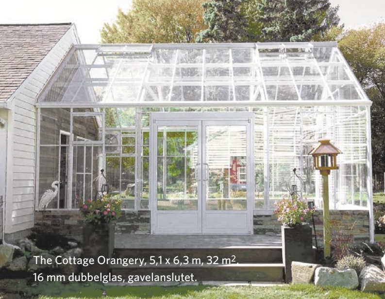
The Cottage Orangery, 5,1 x 6,3 m, 32 m 2 . 16 mm dubbelglas, gavelanslutet.