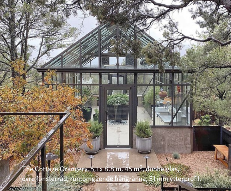
The Cottage Orangeri, 5,1 x 8,8 m, 45 m 2 , dubbelglas, övre fönsterrad, runtomgående hänggränna, 51 mm ytterprofil.