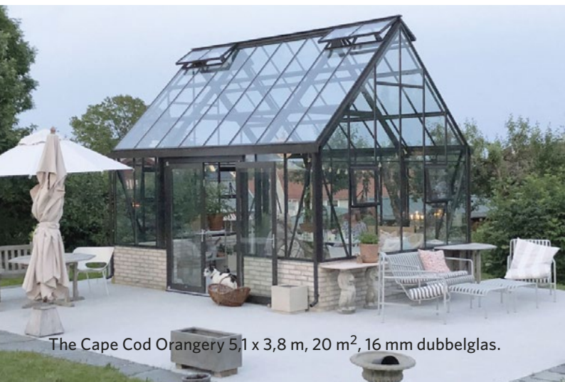
The Cape Cod Orangeri 5,1 x 3,8 m, 20 m 2 , 16 mm dubbelglas.