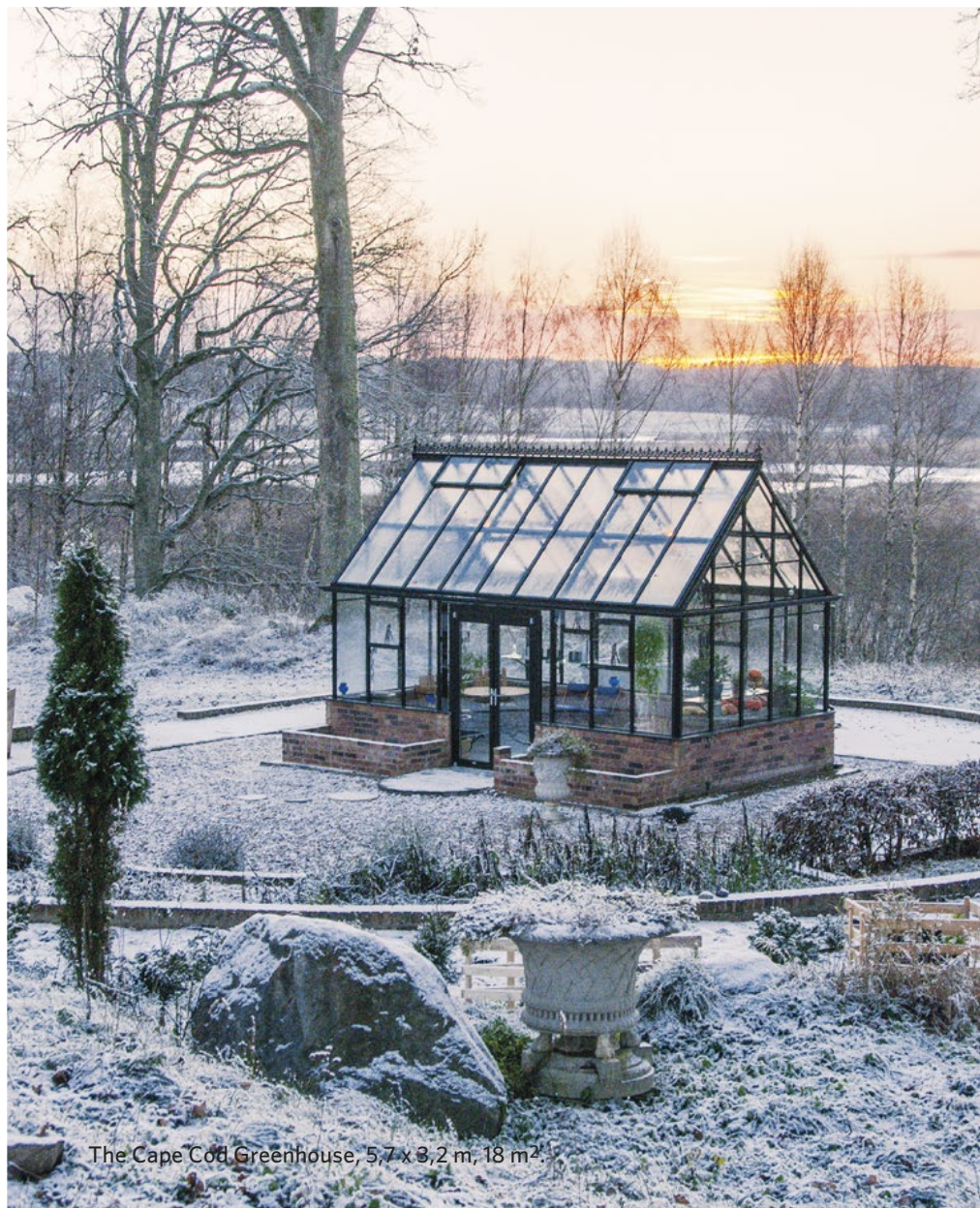
The Cape Cod Greenhouse, 5,7 x 3,2 m, 18 m 2