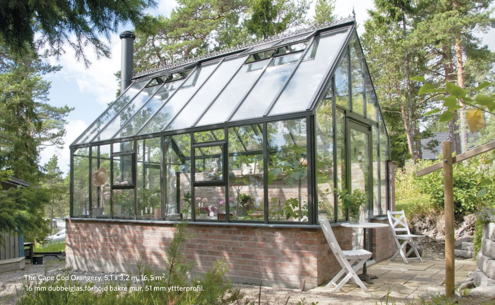
The Cape Cod Orangery, 5,1 x 3,2 m, 16,5 m 2 , 16 mm dubbelglas, förhöjd bakre mur, 51 mm ytterprofil.