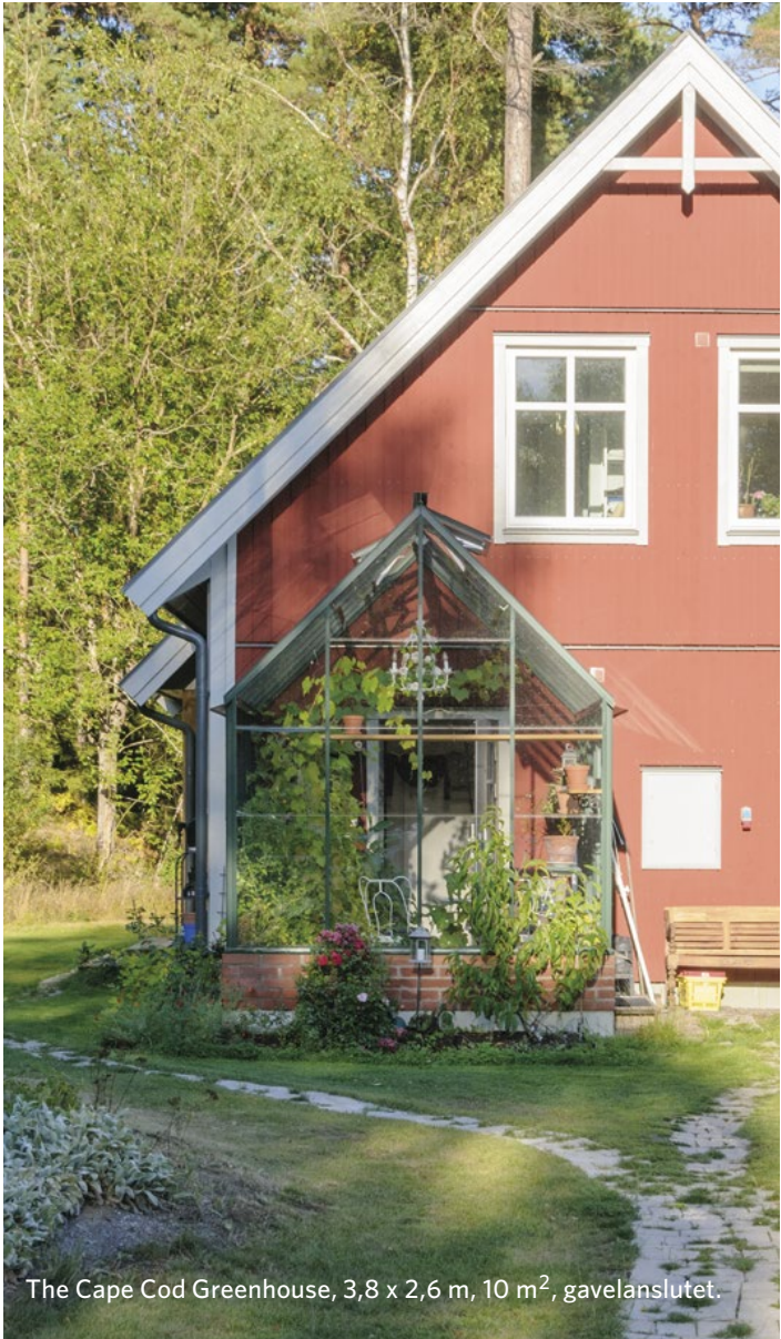
The Cape Cod Greenhouse, 3,8 x 2,6 m, 10 m 2 , gavelanslutet.