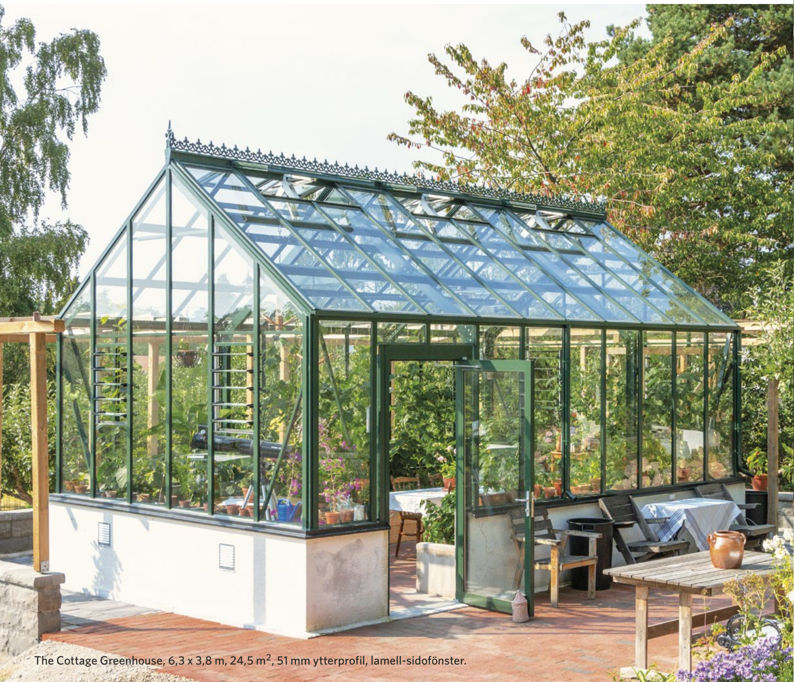
The Cottage Greenhouse, 6,3 x 3,8 m, 24,5 m 2 , 51 mm ytterprofil, lamell-sidofönster.

Växthus och orangerier ger oss många tillfällen att dela naturens skönhet med familj och vänner. Alternativt fungerar de som en lugn tillflyktsort, en vitaliserande plats att njuta några av livets mest givande glädjeämnen – trädgård och odling.