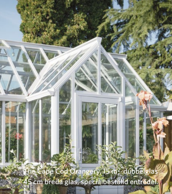
The Cape Cod Orangeri, 15 m 2 , dubbelglas 45 cm breda glas, specialbeställd entrédel.