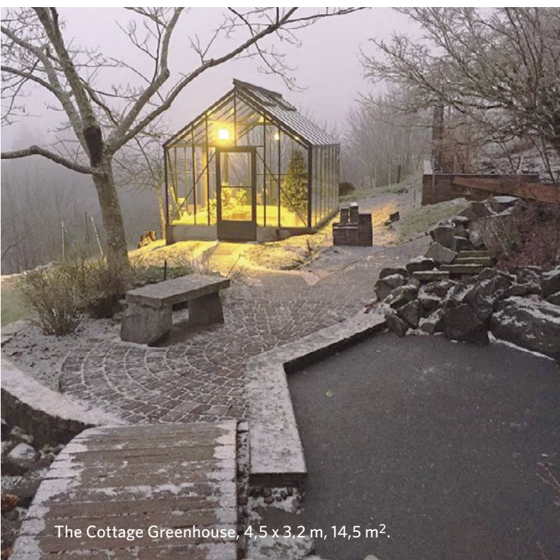
The Cottage Greenhouse, 4,5 x 3,2 m, 14,5 m 2 .