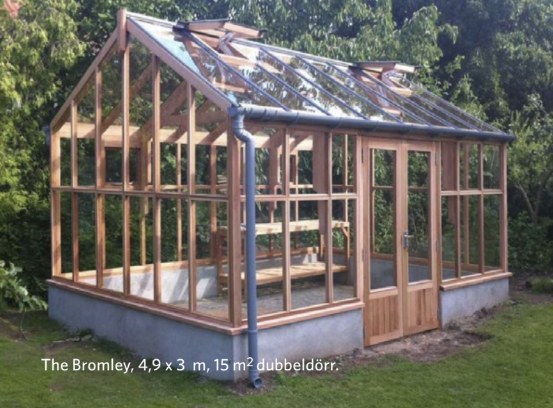
The Bromley, 4,9 x 3 m, 15 m 2 dubbeldörr.