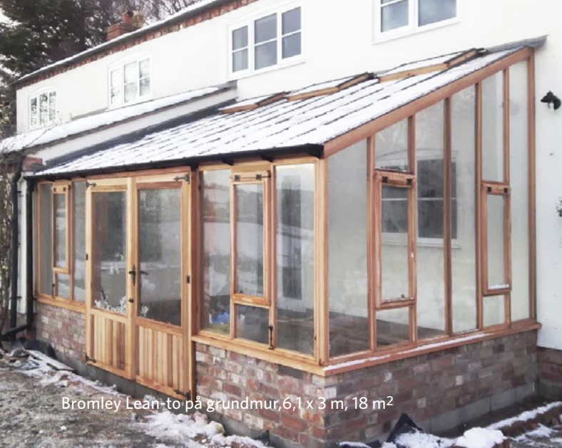
Bromley Lean-to på grundmur, 6,1 x 3 m, 18 m 2