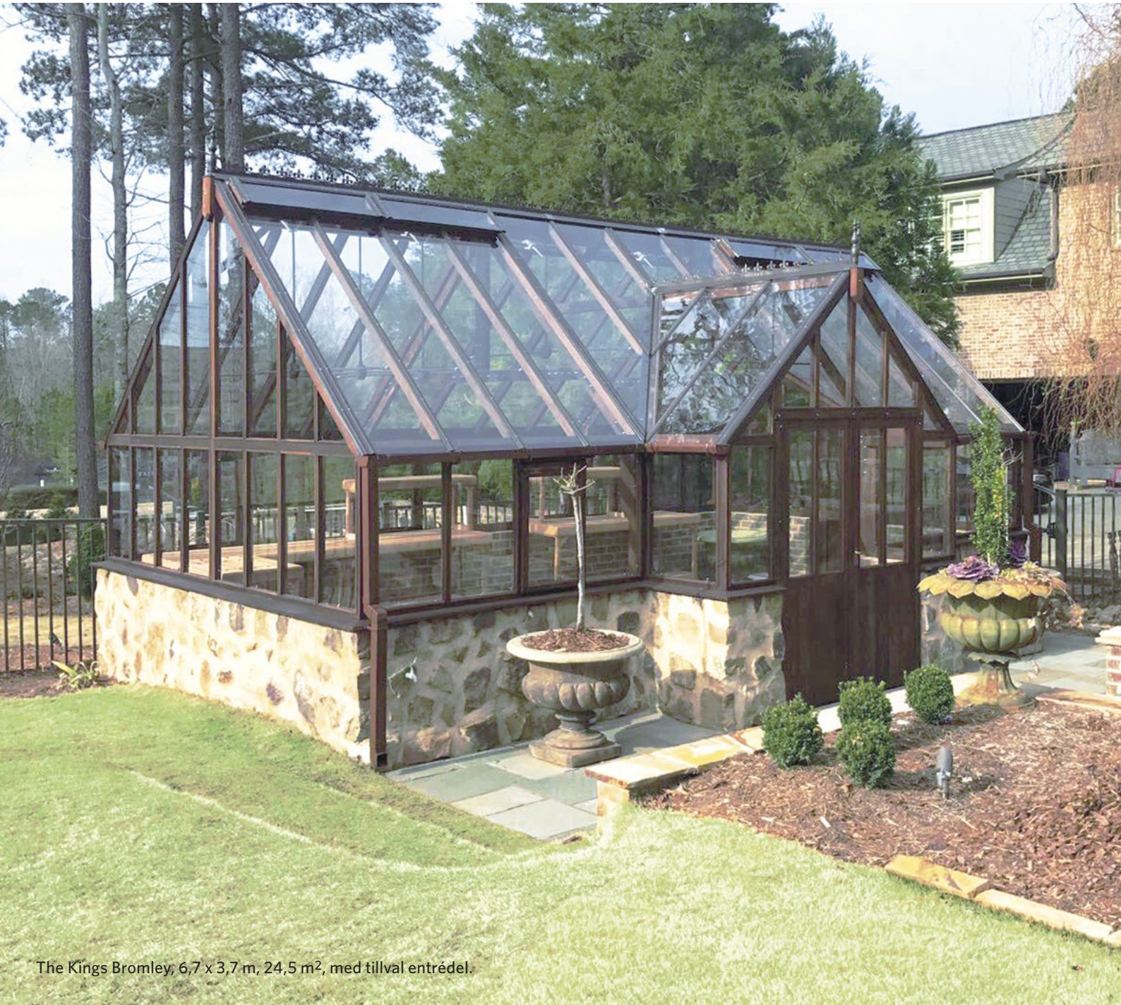
The Kings Bromley, 6,7 x 3,7 m, 24,5 m 2 , med tillval entrédel.