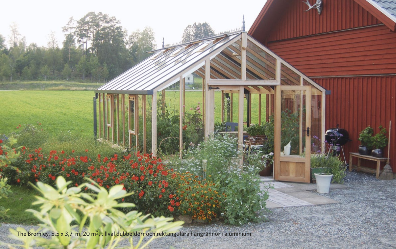
The Bromley, 5,5 x 3,7 m, 20 m 2 , tillval dubbeldörr och rektangulära hängrännor i aluminium.