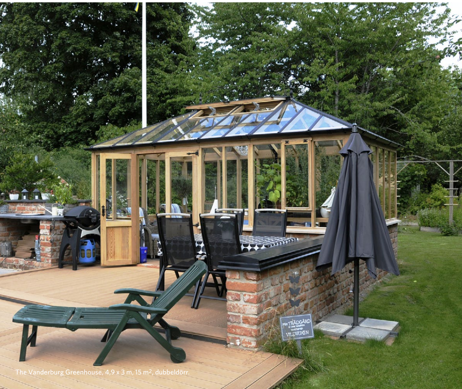
The Vanderburg Greenhouse, 4,9 x 3 m, 15 m 2 , dubbeldörr.

Alla växthusmodeller kan uppgraderas till orangerier med isolerande dubbelglas. Används då året runt, t. ex. för vinterförvaring av medelhavsväxter som olivträd, fuchsia och citrus.