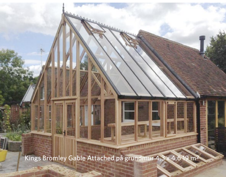
Kings Bromley Gable Attached på grundmur 4,3 x 4,6 19 m 2