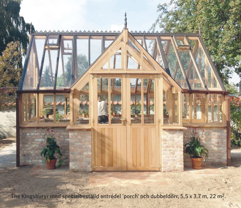
The Kingsbury med specialbeställd entrédel 'porch' och dubbeldörr, 5,5 x 3,7 m, 22 m 2 .