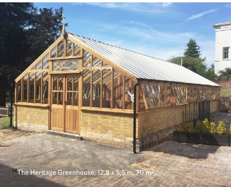
The Heritage Greenhouse, 12,8 x 5,5 m, 70 m 2 .