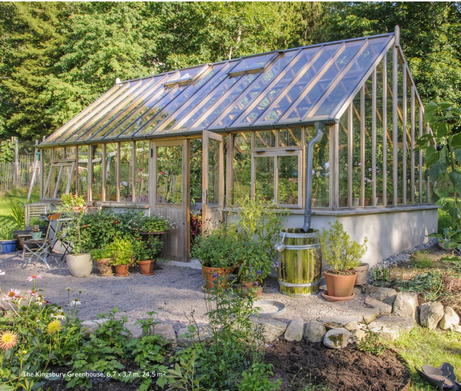
The Kingsbury Greenhouse, 6,7 x 3,7 m, 24,5 m 2