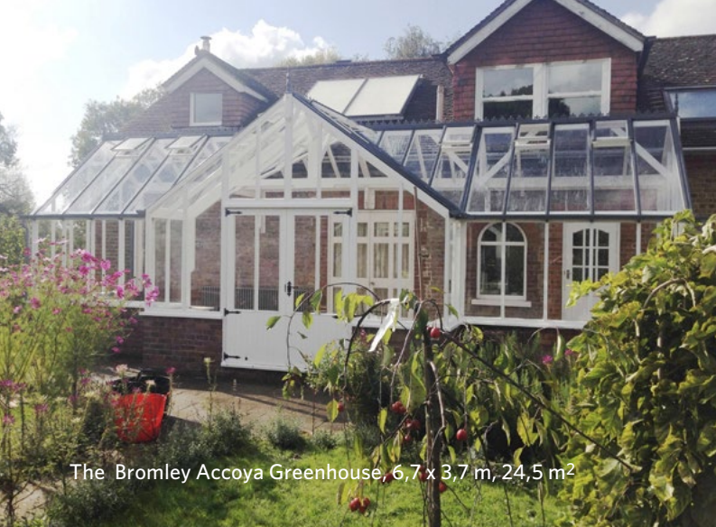
The Bromley Accoya Greenhouse, 6,7 x 3,7 m, 24,5 m 2