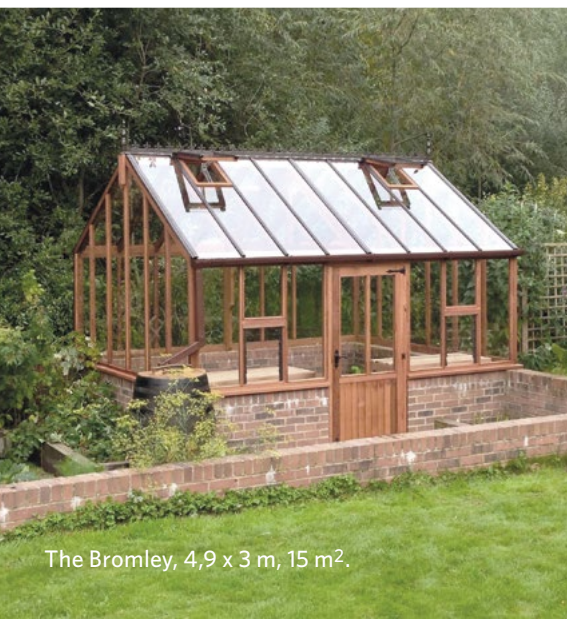
The Bromley, 4,9 x 3 m, 15 m 2 .