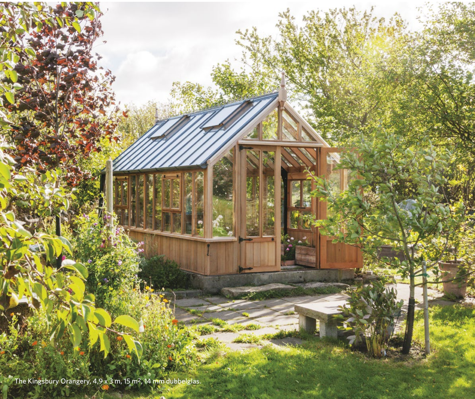
The Kingsbury Orangery, 4,9 x 3 m, 15 m 2 , 14 mm dubbelglas.