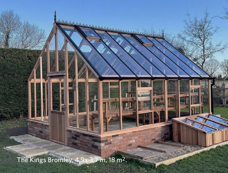
The Kings Bromley, 4,9x3,7 m, 18 m 2 .