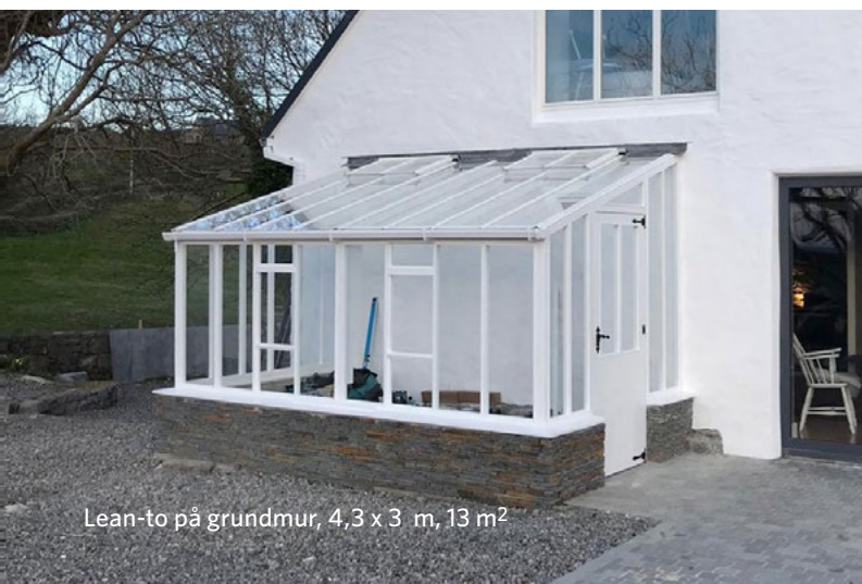
Lean-to på grundmur, 4,3 x 3 m, 13 m 2

Kontakta oss för prisuppgifter och offerter.