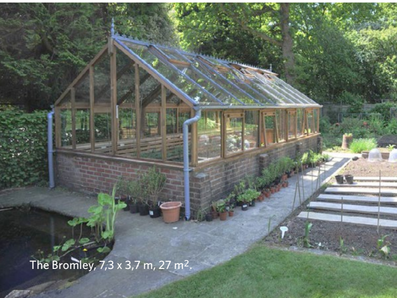
The Bromley, 7,3 x 3,7 m, 27 m 2 .

För andra storlekar, kontakta oss för prisuppgift eller offert: