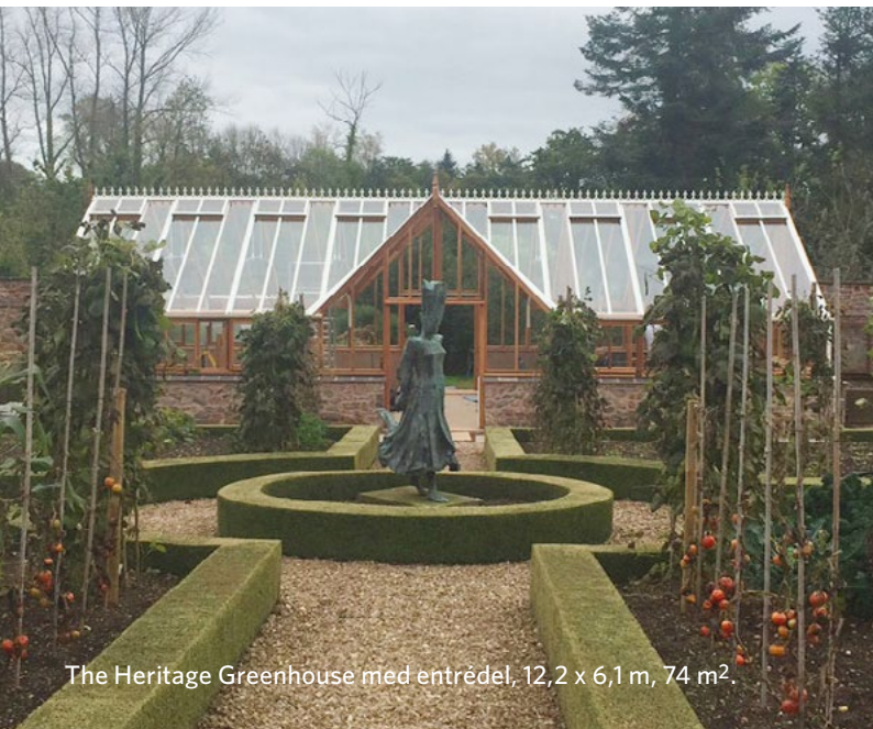
The Heritage Greenhouse med entrédel, 12,2 x 6,1 m, 74 m 2 .