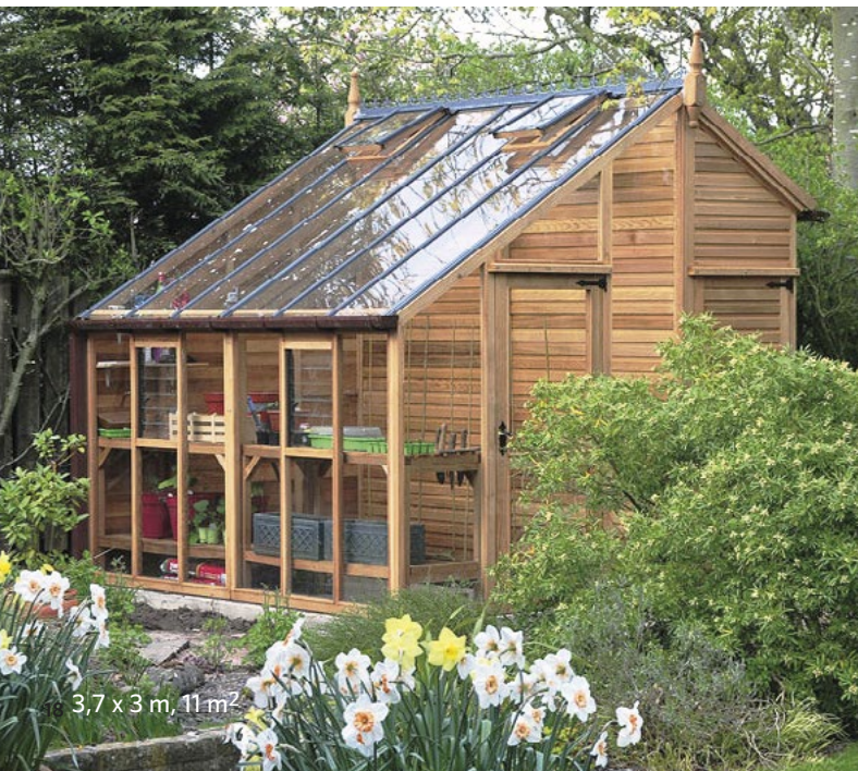
3,7 x 3 m, 11 m 2