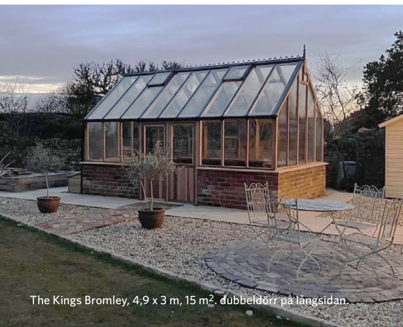
The Kings Bromley, 4,9 x 3 m, 15 m 2 . dubbeldörr på långsidan.