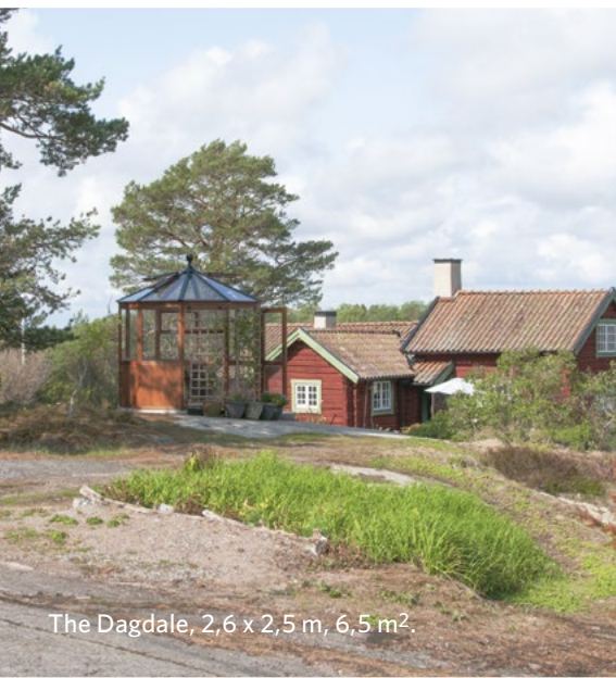
The Dagdale, 2,6 x 2,5 m, 6,5 m 2 .