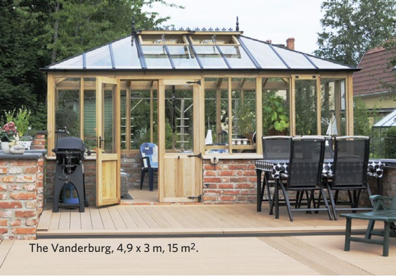
The Vanderburg, 4,9 x 3 m, 15 m 2 .