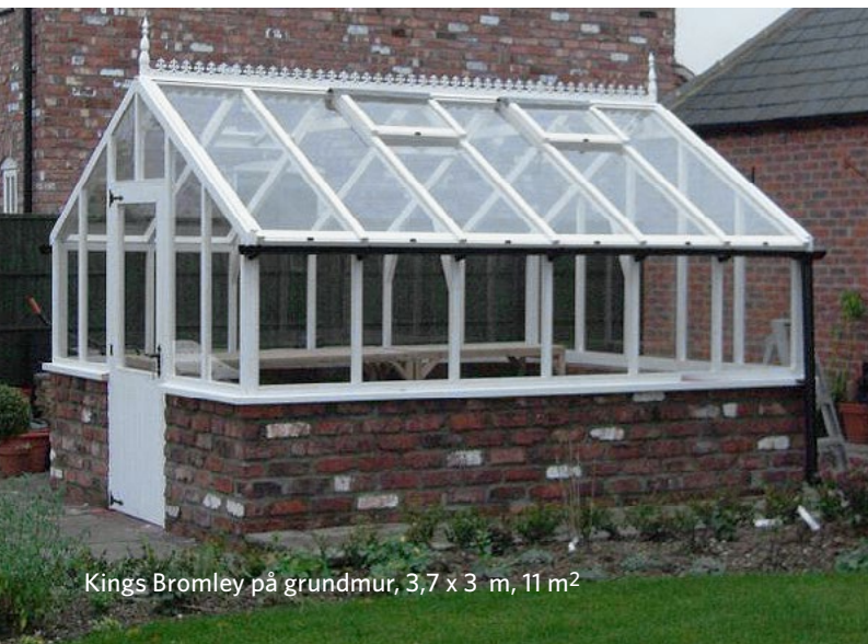
Kings Bromley på grundmur, 3,7 x 3 m, 11 m 2