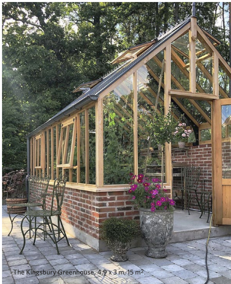
The Kingsbury Greenhouse, 4,9 x 3 m, 15 m 2 .