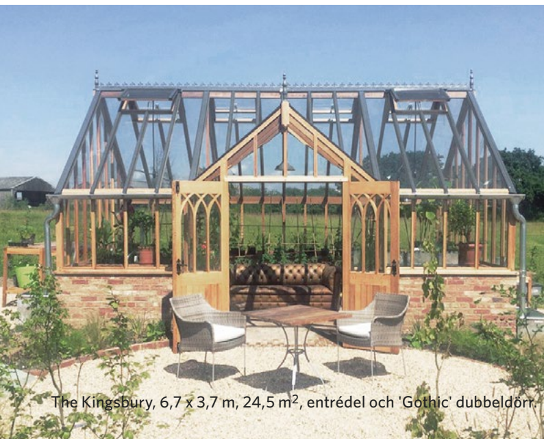
The Kingsbury, 6,7 x 3,7 m, 24,5 m 2 , entrédel och 'Gothic' dubbeldörr.