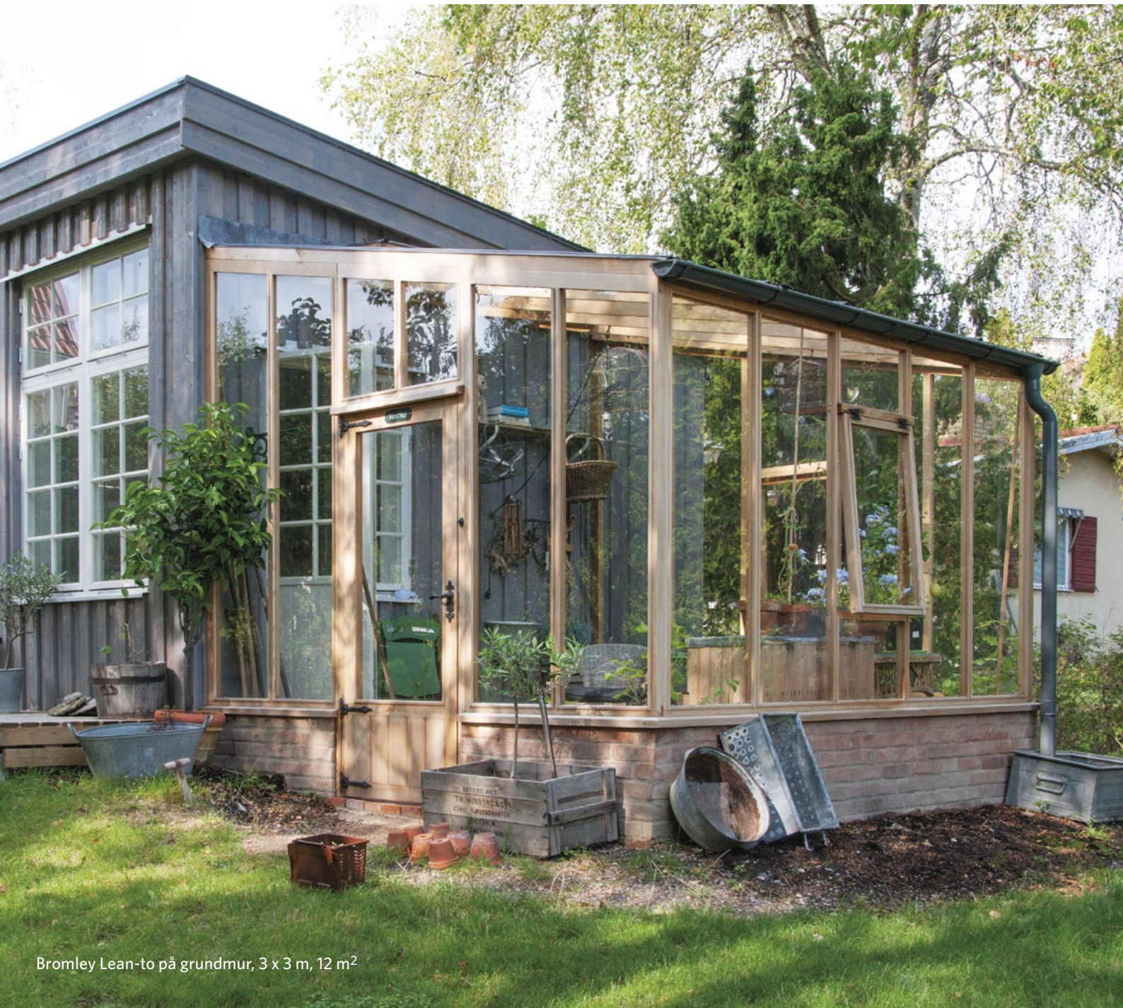
Bromley Lean-to på grundmur, 3 x 3 m, 12 m 2