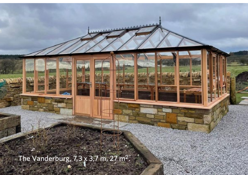
The Vanderburg, 7,3 x 3,7 m, 27 m 2 .

Kontakta oss för offert, prisuppgifter om andra storlekar eller om uppgradering till orangeri med dubbelglas. info@garden-greenhouse.se tel 070-580 20 28