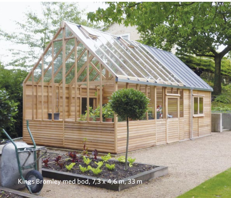
Kings Bromley med bod, 7,3 x 4,6 m, 33 m