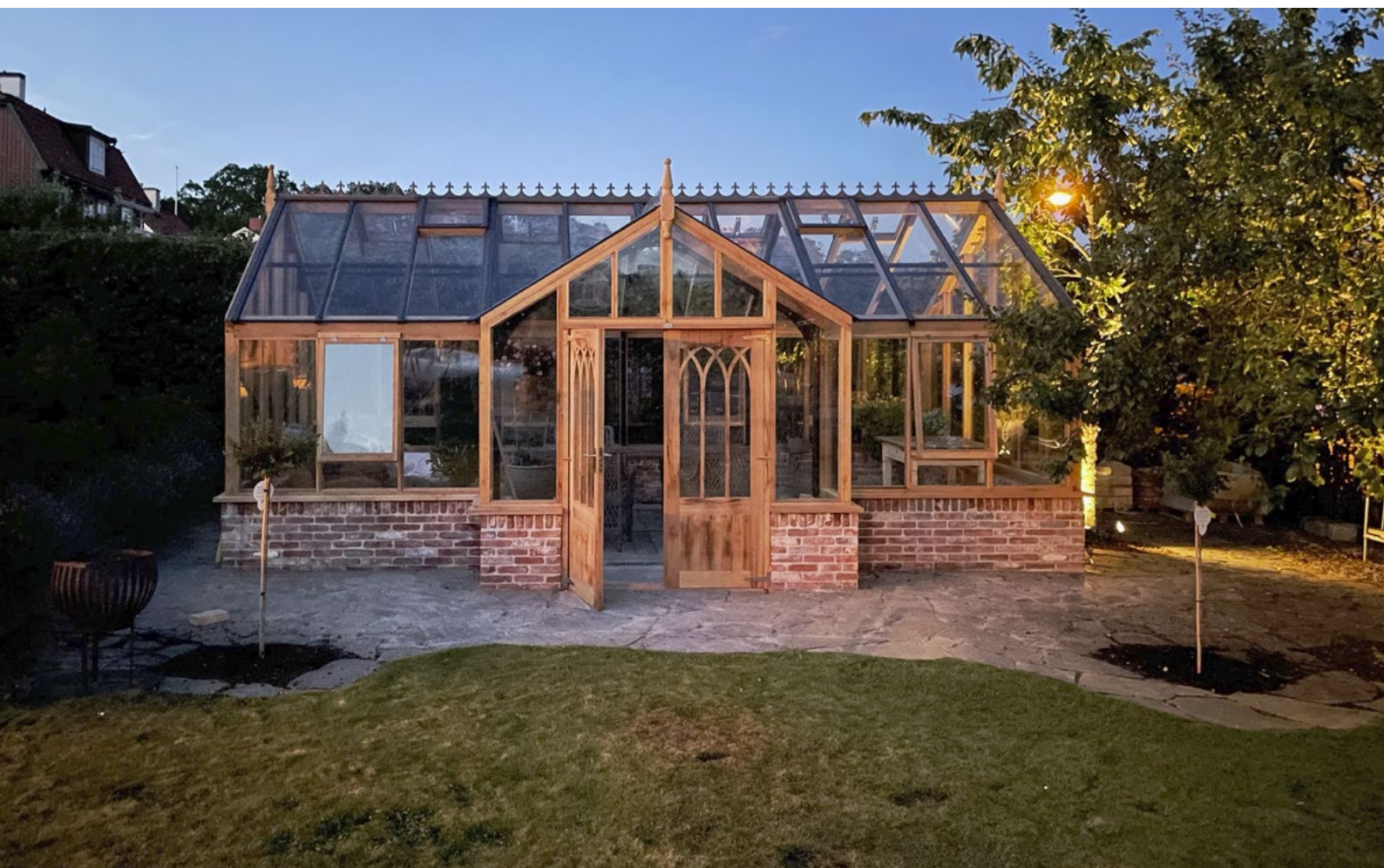
The Bromley Orangery, 6,7 x 3,7 m, 24,5 m 2 , dubbelglas, tillval entrédel med dubbel 'Gothic Door'.