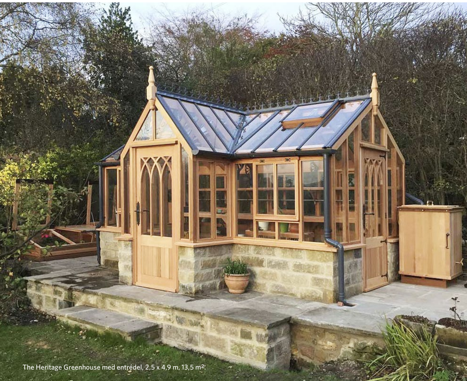
The Heritage Greenhouse med entrédel, 2,5 x 4,9 m, 13,5 m 2 .