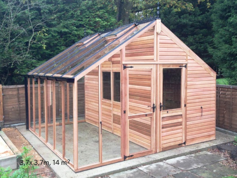
3,7x3,7m, 14 m 2