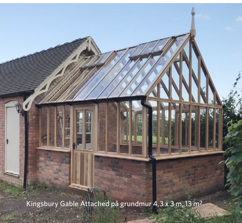
Kingsbury Gable Attached på grundmur 4,3 x 3 m, 13 m 2