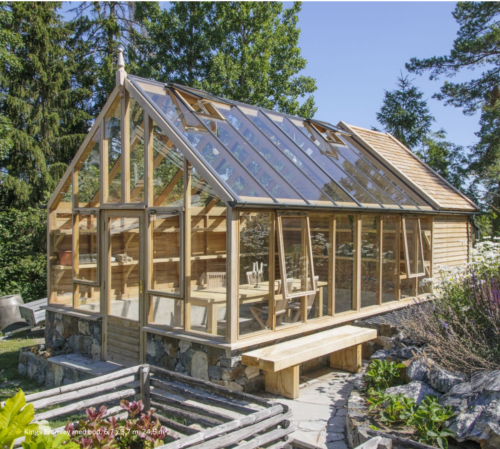
Kings Bromley med bod, 6,7 x 3,7 m, 24,5 m 2