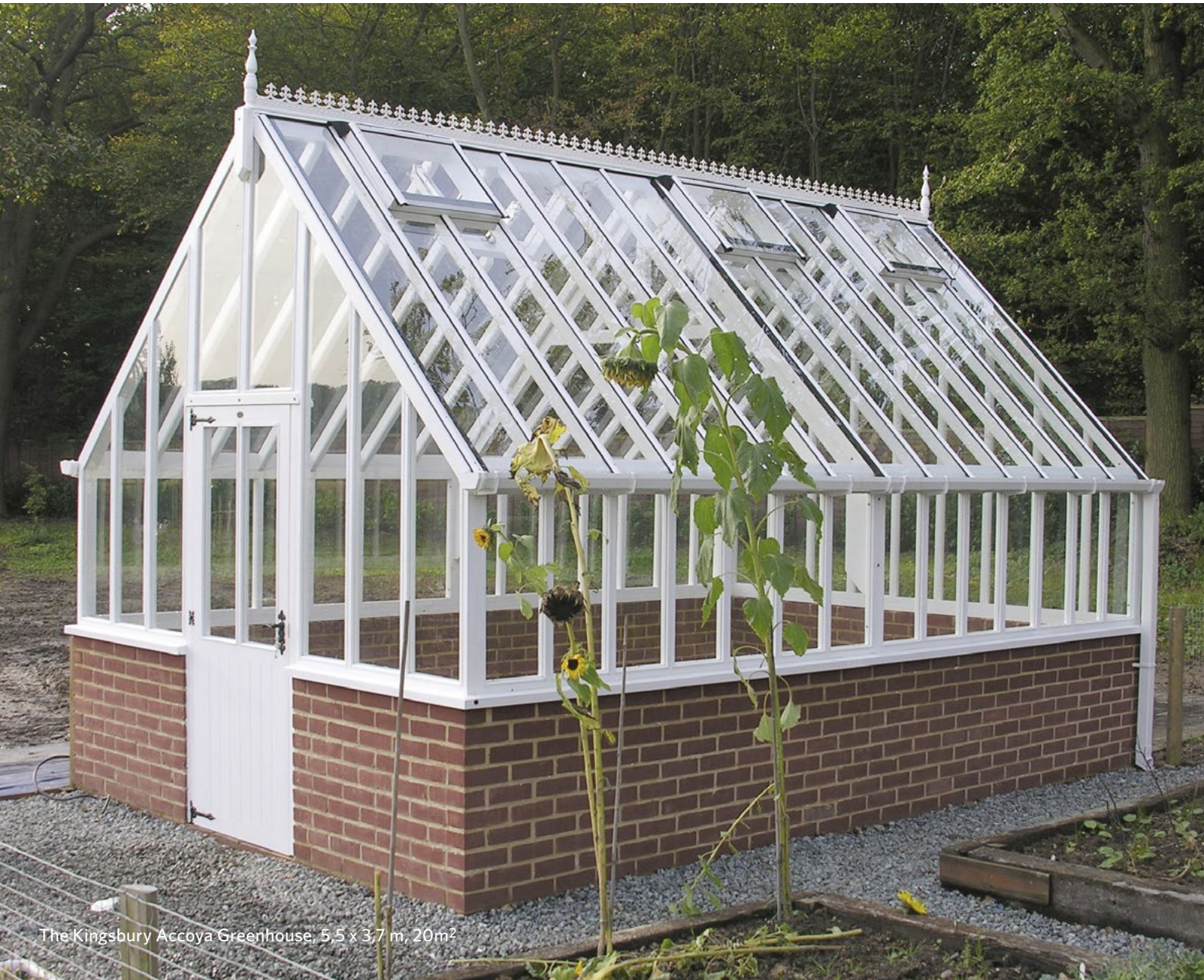
The Kingsbury Accoya Greenhouse, 5.5 x 3.7 m, 20m 2