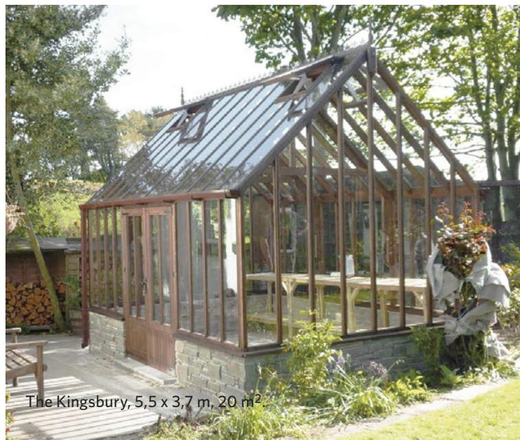
The Kingsbury, 5,5 x 3,7 m, 20 m 2 .