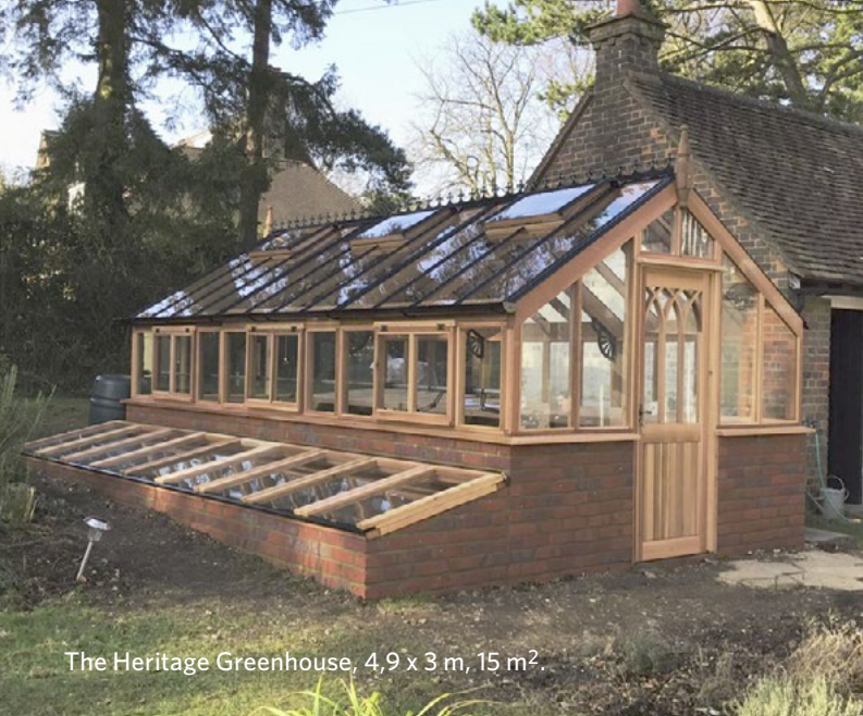
The Heritage Greenhouse, 4,9 x 3 m, 15 m 2 .