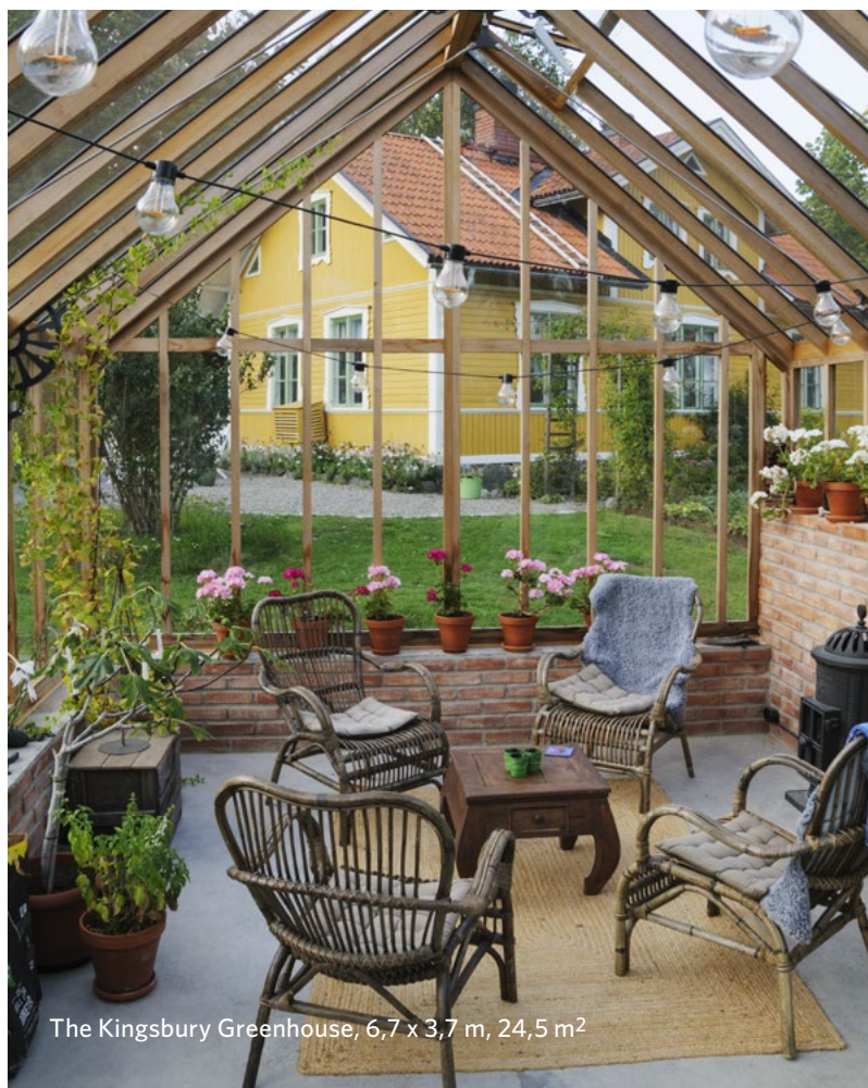
The Kingsbury Greenhouse, 6,7 x 3,7 m, 24,5 m 2