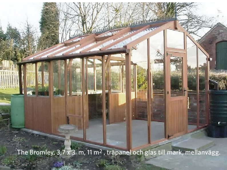
The Bromley, 3,7 x 3 m, 11 m 2 , träpanel och glas till mark, mellanvägg.

Alla priser är inklusive 25% moms och frakt